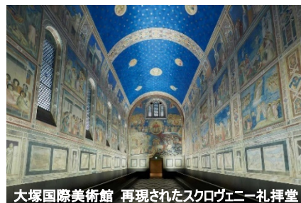
大塚国際美術館 再現されたスロヴェニア礼拝堂